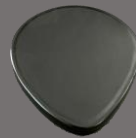
姫鏡 70×80×5 鏡Φ60