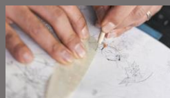
写した図をカットし加工します