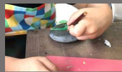
膠で貼り付けます