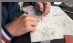
図案を考え螺鈿に写します