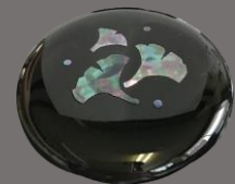
＼ 完成！ ／

樹脂成型素材を使用し、ウレタン塗装仕上げになります。 ※姫鏡、写真立ては木製です。 一週間前までにお電話で、希望日程、時間、人数をご連絡ください。 製品は体験後2週間ほどで仕上げをし、ご自宅へ発送いたします。